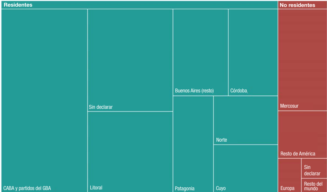
Gráfico 6. Pernoctaciones de viajeros residentes y no residentes. Distribución por región de origen. Junio de 2022